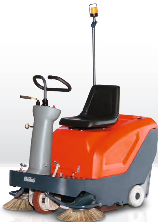
Sweepmaster B800 R